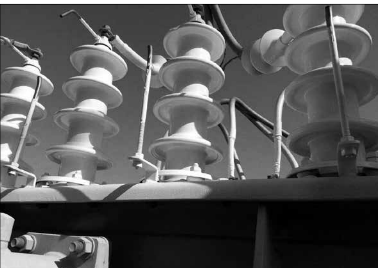
شکل ۵ - اعمال پوشش سیلیکونی آب گریز