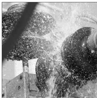
شکل ۴ - شستشوی مقره های توزیع