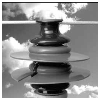
شکل ۷ - افزودن بشقابهای افزایشده فاصله خزشی