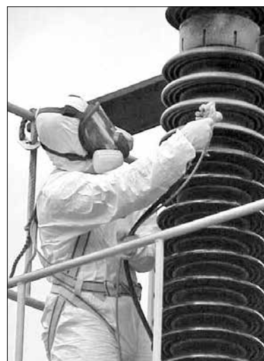
شکل ۶ - اعمال پوشش سیلیکونی آب گریز