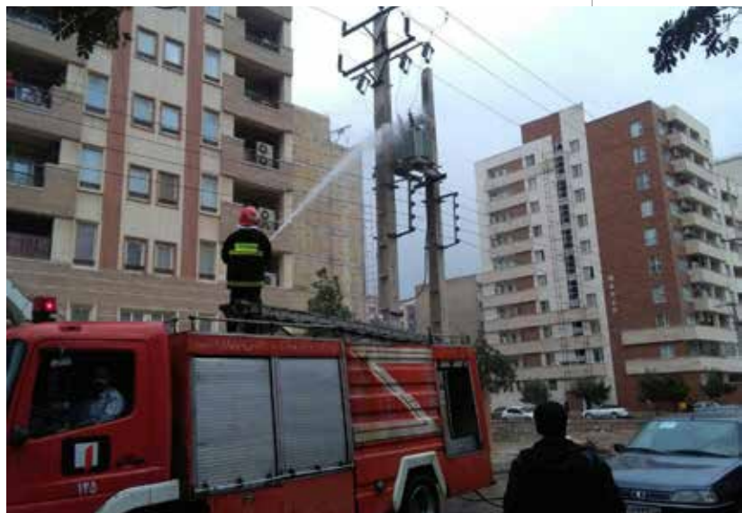
شکل ۳ - شستشوی پوششهای ترانسینگ توزیع

با نصب بشقابهای مخصوص افزایشده فاصله خزشی به مقرر موجود می توان فاصله خزشی مورد نیاز برای منطقه آلوده را تامین نمود. (شکل ۷)